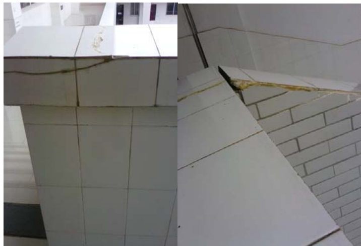
栏杆裂缝使用硅胶维修

2.对院本部教学楼六层走廊栏杆裂缝进行检查、研究整改完案，安排施工队伍于3月2日前完成维修；对院本部教学楼西南角楼梯顶抹灰层脱落进行检查，并安排施工队伍于3月2日前完成整改。