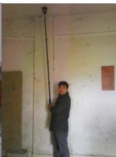
院本部南楼工程建筑安全性检测工作照片