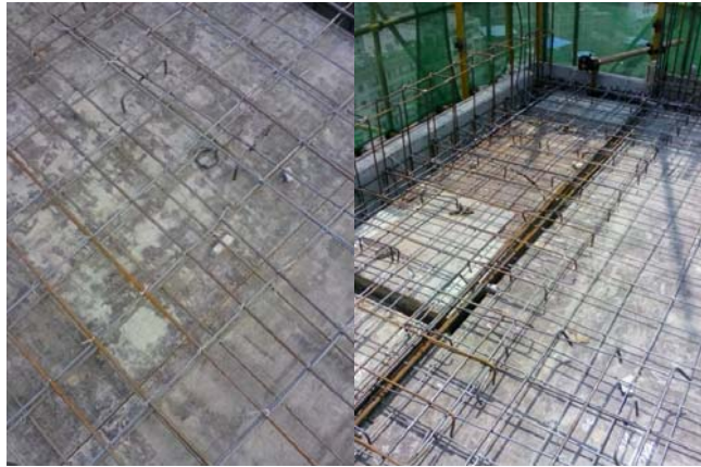
双向板底层钢筋交叉点未按要求进行满绑