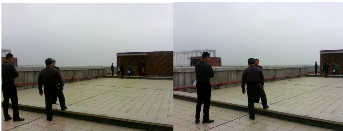
工商管理类实训室现场调研

9. 3月12日至5月27日，对院本部工商管理类实训室、职业素养实训室、会务与交流实训室的建设地点现场调研，与有关部门（院办、教务处、现教中心、公共基础部、经管系）积极沟通，出具并多次修改设计方案，至5月27日，工商管理类实训室、职业素养实训室建设方案已经落实，会务与交流实训室已确定建设方向，三个项目均在施工招标。