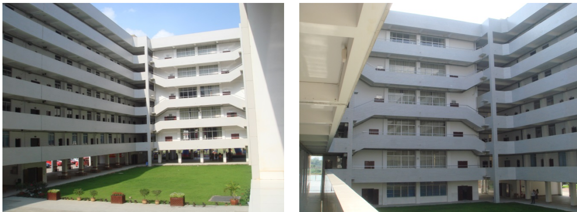
教学楼二至五层护栏安装

7.为了消除教学楼大教室错层造成走廊栏杆偏矮的安全隐患，于3月16日至4月1日采购院本部教学楼二至五层护栏安装工程，确定广西力友建筑工程有限公司为中标单位，施工于4月25日完成并通过竣工验收。