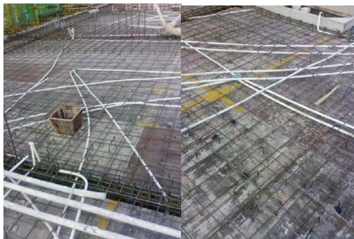
暗敷管线未按要求铺加强钢筋

2.认真做好施工协调工作，确保施工进度。在工作中充分发挥代理方、监理方、施工方、质监站的力量，各方克尽职守，齐抓共管，在各参建单位的共同努力下，目前住宅楼已顺利建至第26层、砖墙砌体完成到第17层施工，取得了重要的阶段性成果。